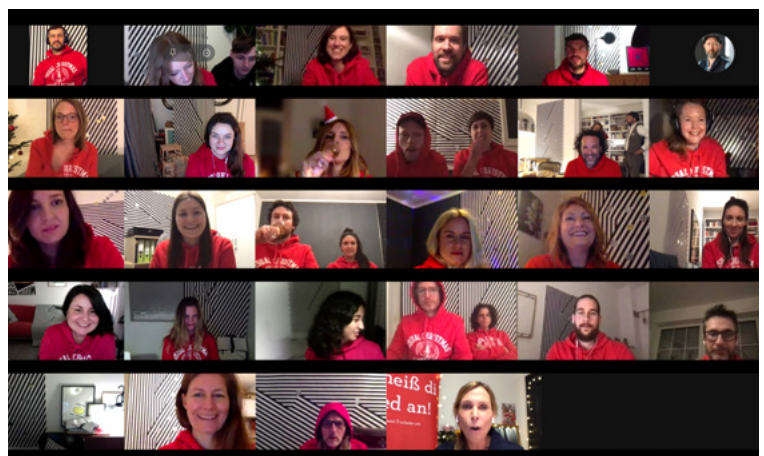
Inspiration fürs neue Arbeitsjahr beim Schimpfwörter-Quiz Averroes Concept Lounge GmbH