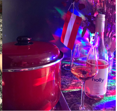
Digitale Mitgliederversammlung mit Knödel-Wörkshop & Disco-Party Rotary Club Frankfurt Airport